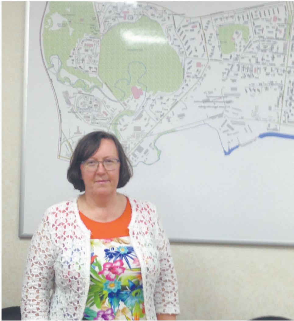
Уважаемые жители Южного Тушино!

Разрешите побеседовать с вами о неотложных насущных проблемах района, попросить совета, провести анализ проделанной работы.