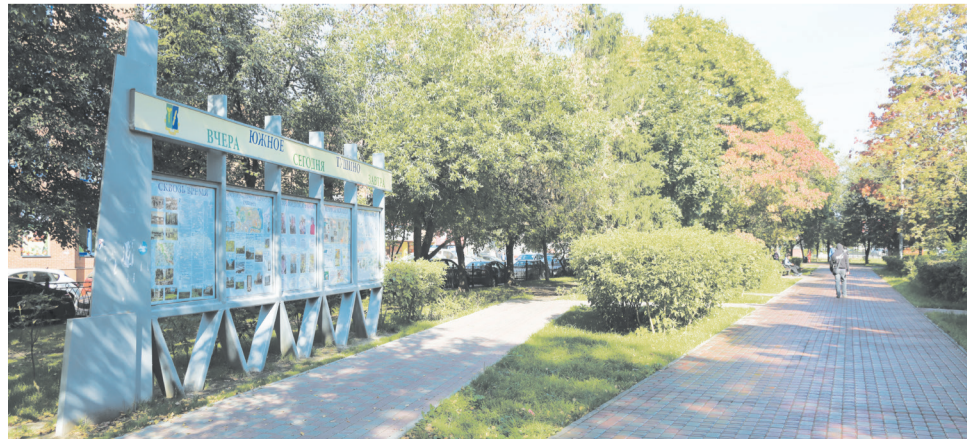
Парковая зона около м. Сходненская

— В преддверии Нового года хочу пожелать всем жителям района крепкого здоровья, долгих лет жизни, бодрости духа, удачи, благополучия, любви, заботы и тепла со стороны родных и близких!